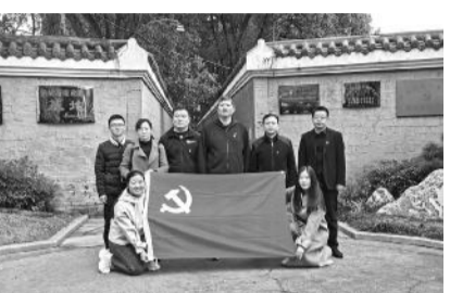
机械工程学院教工第二党支部

V Dg>d(Du 521 hVXY d 45 8. M,h^a ]W,h B^M O, 215 4j DE V a Dg vw, h@ D ( DE$: M O, T照 d O75 "h \ "<, 21S ( )5 NO, 5 NO, 监督5 NO, 7w5 NOE S 5 , , r "\. ; $", , " , E, , s, 75 Fo m , 监督, NI 21F7w [ S: AB, S\构 >V, $ /, 7w 521, ] 5 F` a] ^ WE FA2O, \ = : ; , h养, > , 8. 7 w DE p . 一、教育党员有力 U) \a [ , 5 ( ) 2$ / , l m" j , G _ ( B( ) . hU) 8 数, >V( ) 89, O>V5F, C\ => , 5 >V(VXY89" j , G _ 1 ^ ) (VXY d 45 8. ^ _>V 21Gf 4 B>V 5 > 相[ , p , 相[ F x 2$ l m56>V( ) . BU! "#$5F 策, qr 执 pL5 X