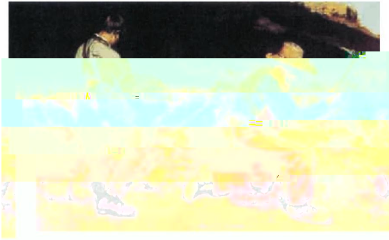
石工 (油画, 1849年) 库尔贝 (法国)